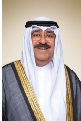
سمو الشيخ مشعل التّحمد الجابر الصباح أمير دولة الكويت