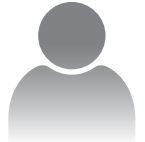
ممثل بنك الخليج