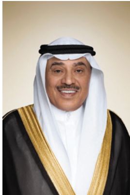
سمو الشيخ مبارك الخالد الصباح ولي عهد دولة الكويت